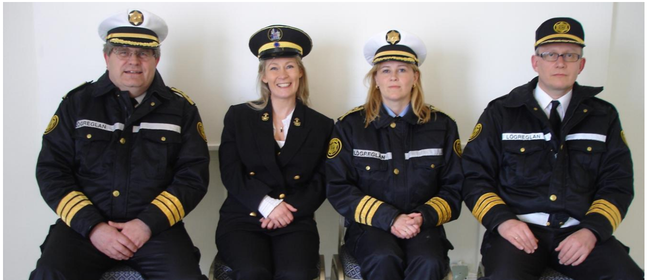
Síðasti samráðsfundur lögreglustjóra á Vestfjörðum fyrir sameiningu lögregluumdæma, haldinn í Bjarkarlundi 2006.