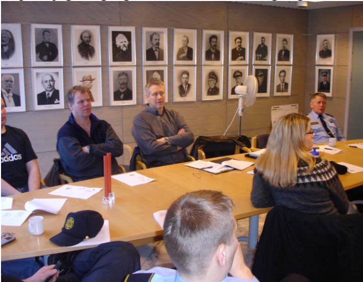
Fundur lögreglumanna vegna „Kletts“

Farið var í sérstakt fíkniefnaátak í ársbyrjun 2006 sem stóð í þrjá mánuði og fékk aðgerðin heitið „Kletturinn“ Ekki verður gefið upp hvaða starfsaðferðum var beitt en góður árangur náðist og má þakka því samheldni lögregluliðsins og áhuga manna á að efla þekkingu sína á þessu sviði. Má segja að átakið standi enn því mjög öflugt og virkt eftirlit er með mögulegum innflutningi og sölu fíkniefna í umdæminu.