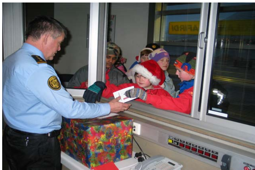
Yfirlögregluþjónn tekur á móti jólagetraunaseðlum ungra barna í umdæminu.

Í stefnumótun embættisins kemur m.a. fram, að bæta þurfi skjalastjórnun innan embættisins og að þörf sé á nýjum hugbúnaði vegna þessa. Þetta markmið náðist ekki á árinu 2004, en von er á úrbótum á árinu 2005, í tengslum við sérstakar áherslur tölvumiðstöðvar dómsmálaráðuneytisins. Á hinn bóginn voru lögð drög að verulegum umbótum er lúta að skilvirkni í tengslum við fyrirhugað samstarf lögreglunnar á Ísafirði við Fjarfskiptamiðstöð lögreglu. Dómsmálaráðherra veitti styrk til tækjakaupa til þess að unnt væri að nýta nýja tækni og gera varðstjóra kleift að fara á vettvang þegar þörf er á þannig að fjarfskiptamiðstöðin vakti lögreglustöð á meðan. Ráðherrann tilkynnti um styrkveitinguna í heimsókn sinni í embættið og opnar hún marga nýja möguleika við löggæslu í umdæminu.