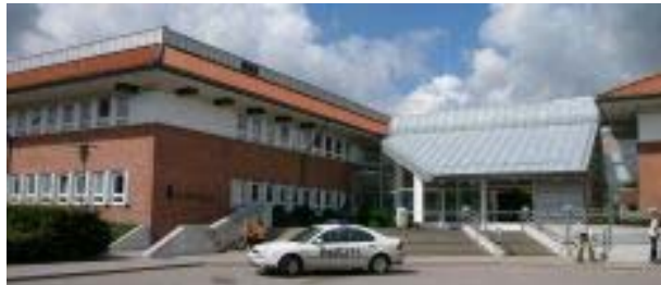
Lögreglustöðin í Glostrup

Einn fjögurra varðstjóra fékk styrk frá Norrænu ráðherranefndinni til þess að starfa á erlendri grundu. Dvaldi hann og starfaði í góðu yfirlæti í lögregluumdæminu í Glostrup í þrjá mánuði.