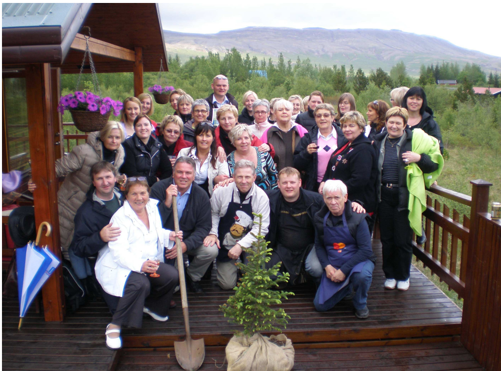
Starfsmenn sýslumannsins í Hafnarfirði í skógræktarferð