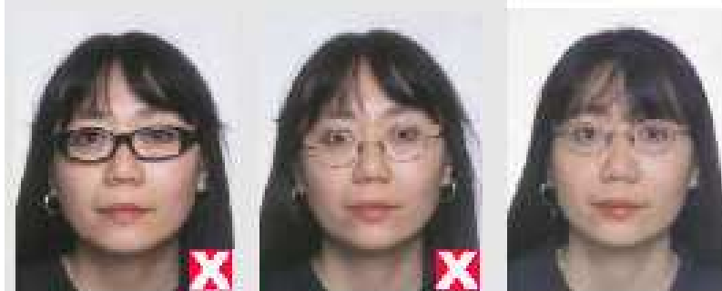
Umgjörð of þykk